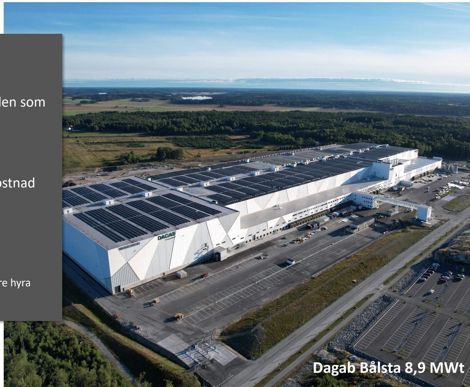
Dagab Bålsta 8,9 MWt